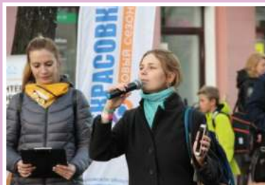
«Время читать» в рамках акции «Некрасовка. Новый сезон»