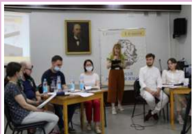
«Эпистолярная дуэль» в рамках «Недели русского языка»